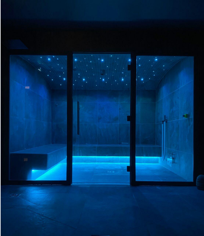
Hôtel 16 -150

Textes : Anne-Marie Cattelain-Le Dû et Béatrice Thivend-Grignola